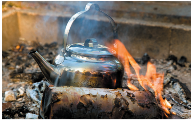
Kaffestund vid rastplatsen