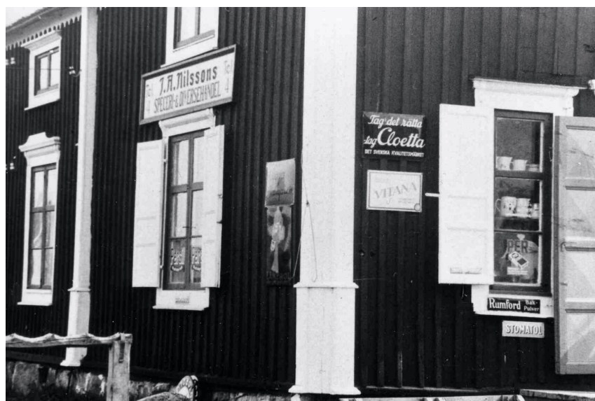
Axel-Nilsabutiken. Lägg märke till den väl gnagda plankan där man fäste hästarna.