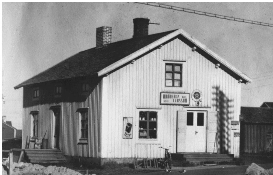
Albert-Lärsabutiken med affärsingång mot vägen. Lägg märke till skuggan till höger om dörren.