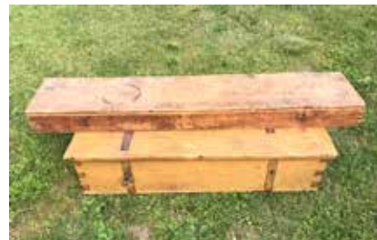
Byakistan målad i guldockra och ovanpå kistan det särskilda skrinet för kartor.

Till detta kulturarv hör också Byakistan (se bild). Den kan vi kalla dåtidens arkiv. Innehållet domineras av rättshandlingar. Inte så sällan uppstod tvister, främst om markägande, som hamnade i domstol. Sådana problem är tack och lov sällsynta i våra dagar. Samfälligheten har ambitionen att katalogisera kistans innehåll och översätta vissa handlingar till nutidsvenska.