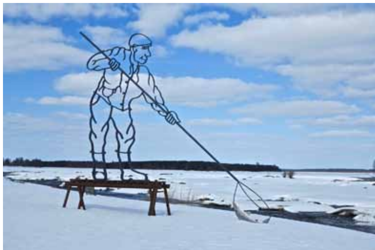
Vid Kukkolaforsen