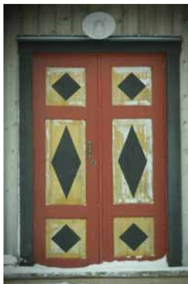
Ingången till bagarstugan. En stark kandidat till titeln "Byns vackraste ytterdörr".

NS: Genom att Norge inte varit en självständig stat så länge (1905) är vi väldigt stolta över vår självständighet. Vår stolthet bygger också på att vi lyckades bygga upp Norge efter den tyska ockupationen under andra världskriget. Det är främst dessa två faktorer som förklarar att firandet av sjuttonde maj är så stort i Norge.