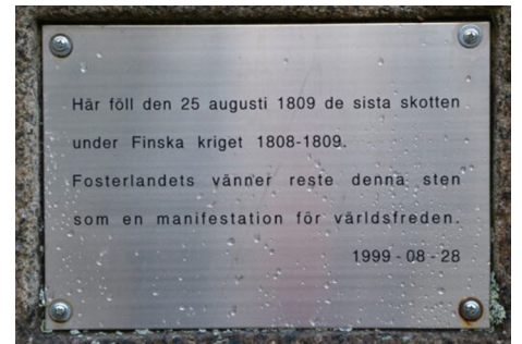
Bilderna från Svenska Militära Minnesmärken Registerkort Nr Ö06