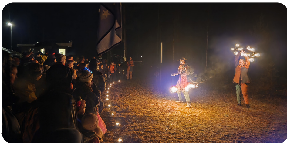
Från avslutningen med eldshowen