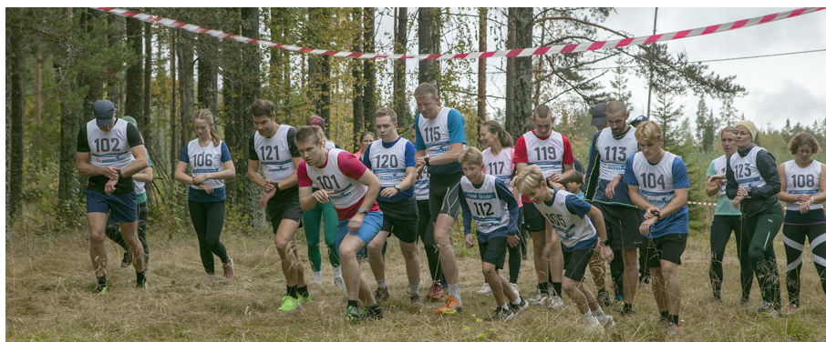
Starten av 6 km i Hembergsutmaningen 2025

Söndag 21 september var det Hembergsutmaningen som traditionsenligt arrangeras av Ersnäs IF i samarbete med Snabba Steg. Ett 40-tal deltagare trotsade väderprognosen och gudarna var med oss, inte en droppe föll under tävlingen, de första dropparna kom efter tävlingen.