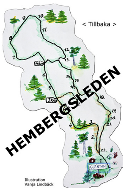
Illustration Vanja Lindbäck

Denna led passerar också Hembergets högsta punkt som på kartan är angiven till 95,3 meter över havet. Alldeles i närheten av den punkten finns rastplatsen Vidablick som verkligen gör skäl för namnet. Här fångar