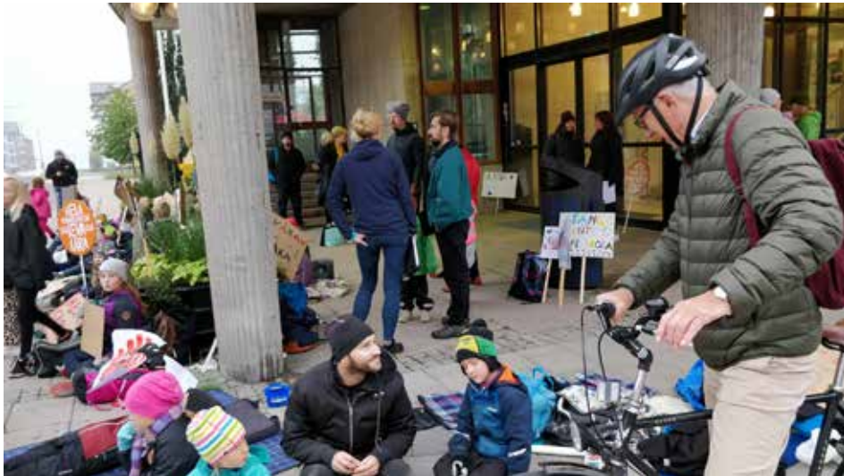
Skolbarnen sittstrejkar utanför Stadshuset 2019-09-10

"Hela kommunen ska leva och lära" behöver vårt stöd.