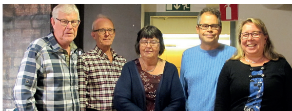
Arrangörerna i en paus