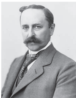
Nils Edén, en blivande statsminister som gjorde många resor genom Ersnäs by på dåvarande rikstretton på sin väg Piteå-Luleå-Piteå.

Och vi norrbottningar har en speciell anledning att känna stolthet med anledning av detta beslut. I oktober 1917 tillträdde en regering med liberalen Nils Edén som statsminister. Regeringen var en koalition av liberaler och socialdemokrater. Frågan om kvinnlig rösträtt hade första gången väckts i riksdagen 1884. Högern (det parti som idag heter Moderaterna) gjorde under alla år ett hårdnackat motstånd. Detta