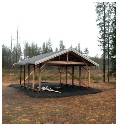
Bygget söndag 2018-11-11

På Gläntan/Skidstadion har det uppförts en ny byggnad – en carport som skall användas för förvaring/skydd åt spårutrustning. Idrottsförening har länge funderat kring hur sladd och spårmaskin skall förvaras och nu är den äntligen på plats.