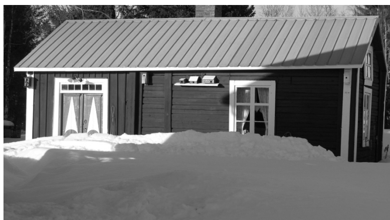
Petterssonsbagarstugan med fina gamla dörrar.