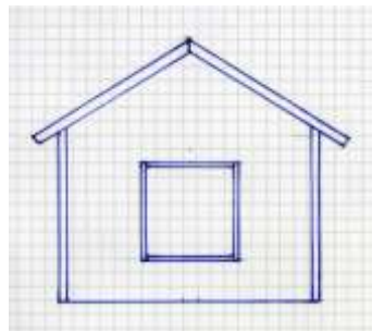
Gaveln mot vägen.

Ungefär så här såg Mejeriets isboda ut. På östra långväggen var det en dubbeldörr som dessutom var delad vågrätt så att det bildades fyra ”luckor”.