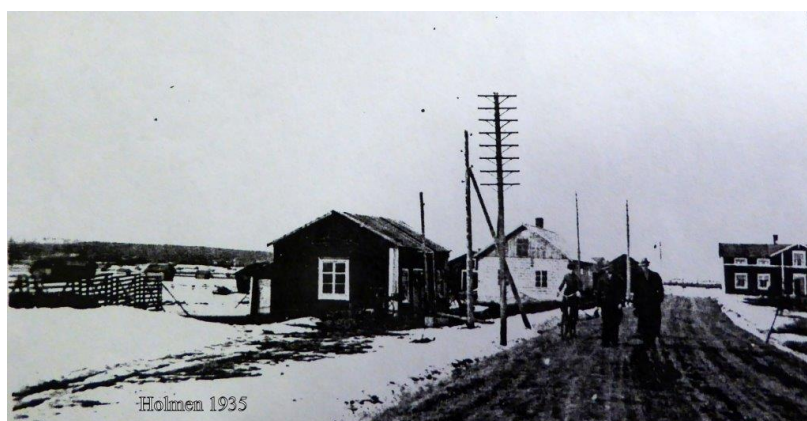
Gamla smedjan från 1875, nya smedjan från 1935