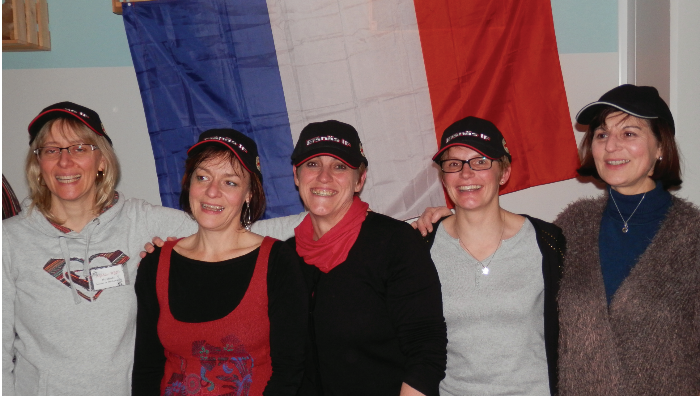
Glada franska lärare vid sitt första Luleåbesök med keps från Ersnäs IF som huvudbonad.

I september 2014 startade ett EU-finansierat skolprojekt, som avslutas i augusti i år. Hedens förskola i Antnäs, Ersnässkolan, Bergsskolan och Örnässkolan är engagerade från svensk sida. Motsvarande skolor är med i projektet från fransk sida. Både lärare och elever deltar i detta utbyte som sker i form av personliga möten, utväxling av dokument och idéer via internet.