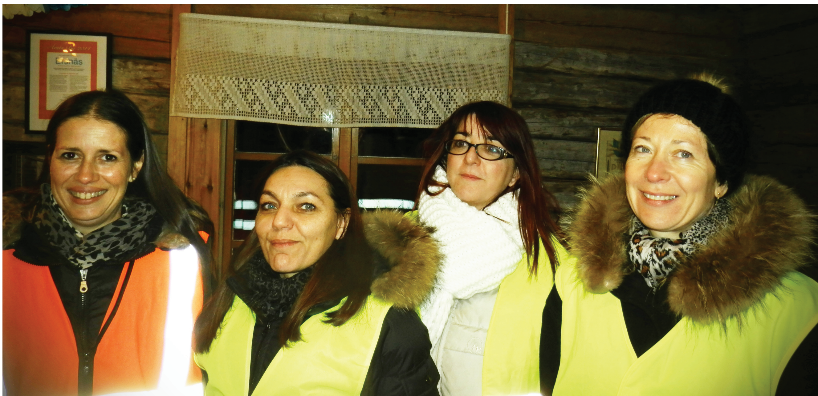
Ett annat gäng franska lärare, denna gång på väg ut i den norrbottniska vinternatten.

Deltagarna i projektet tar del av varandras pedagogiska metoder och erfarenheter för ömsesidig stimulans. Förståelsen och intresset för andra kulturer ökar. Deltagarnas förmåga att uppskatta både ett annat lands men även det egna landets fördelar utvecklas.