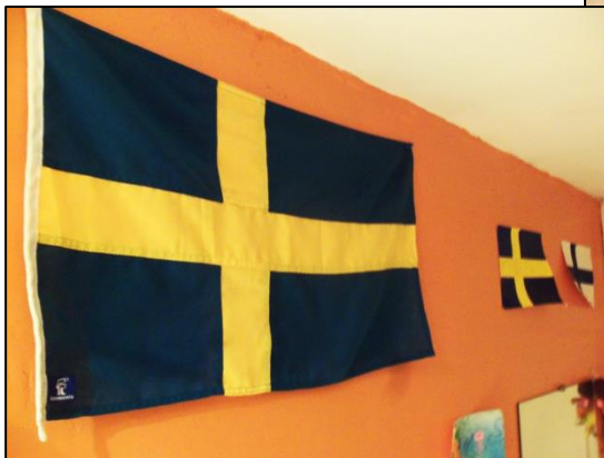
Mitt lilla mediatek för att inte glömma Sverige

Jag är sålunda tillbaka i Novéant, till mitt liv här och till min familj. Här tillåter jag mig några dagars semester innan jag – så snart jag hittar ett lämpligt erbjudande - påbörjar en praktikperiod inom mitt studieområde personalfrågor (HR som det heter på nysvenska; övers anm) och fortsätter mina mastersstudier i filosofi. Jag måste medge att det är rätt så svårt att på nytt anpassa sig till livet i mitt hemland. Mitt sovande och mitt matintag har fullständigt rubbats. Bastubad, fikapauser med Västerbottensost, de vilda djuren i norr, det svenska landskapets fina färger, känslan att varje dag lära sig något nytt och förhållandet att tala "fransvenska" (ett ord som jag har bildat för att beskriva blandningen av franska, engelska och svenska) är något jag saknar. Vilket inte hindrar att jag är nöjd med att återvända till mina rötter.