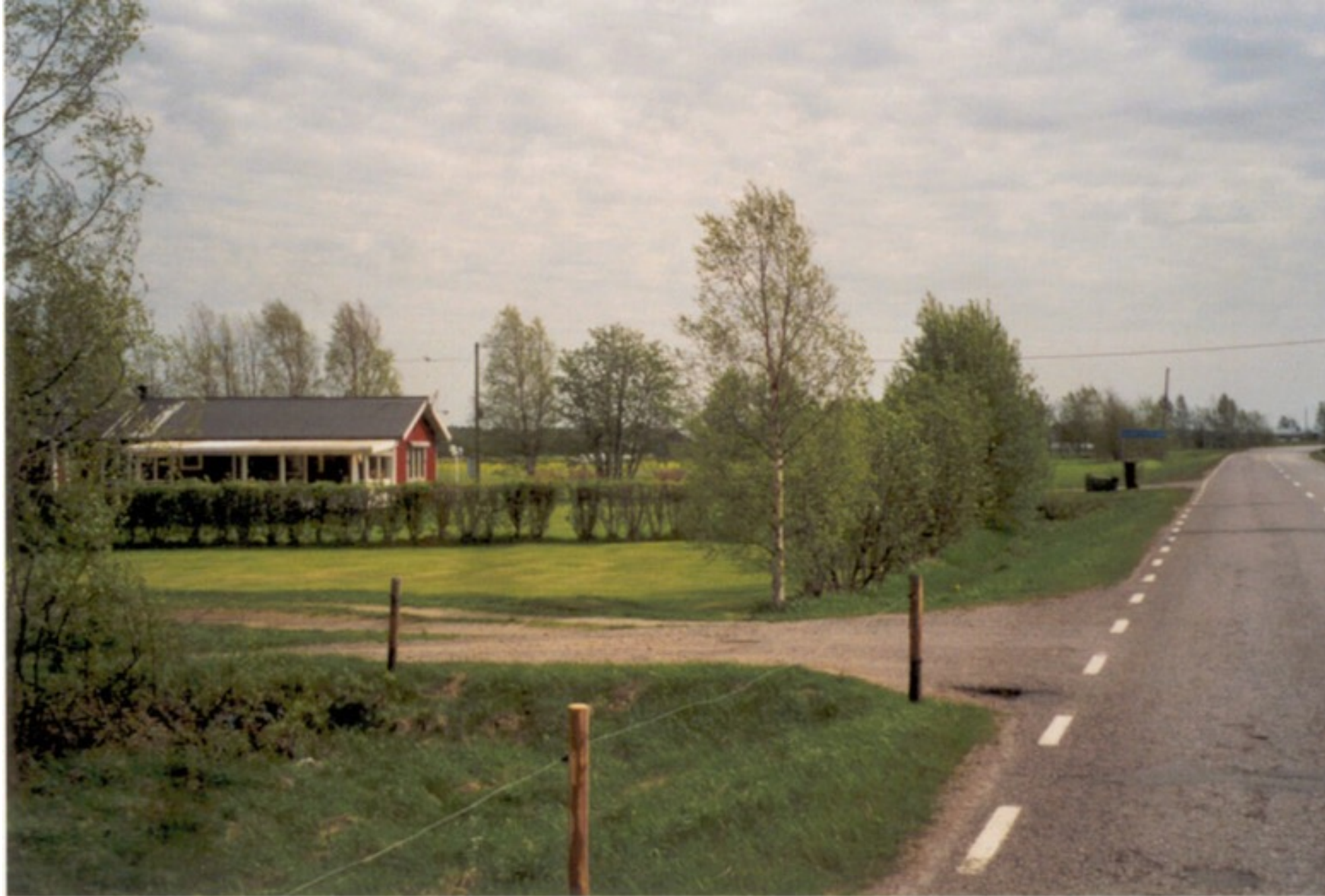
16 B S. Ny-DåLas. Ny s-stuga byggd av Holger G. 1980-tal. Äg. 2001? Foto Folke Larsson 2001.