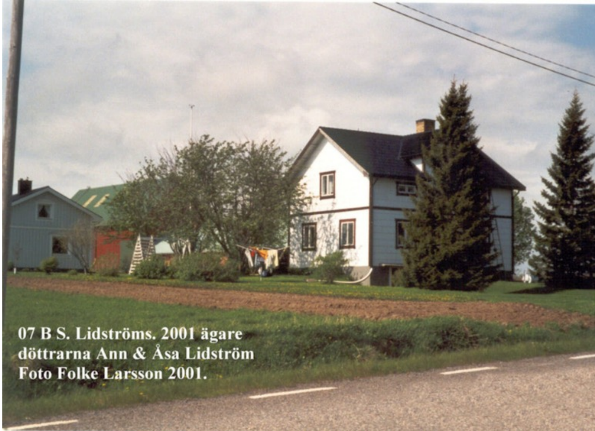
07 B S. Lidströms. 2001 ägare döttrarna Ann & Åsa Lidström 2001.