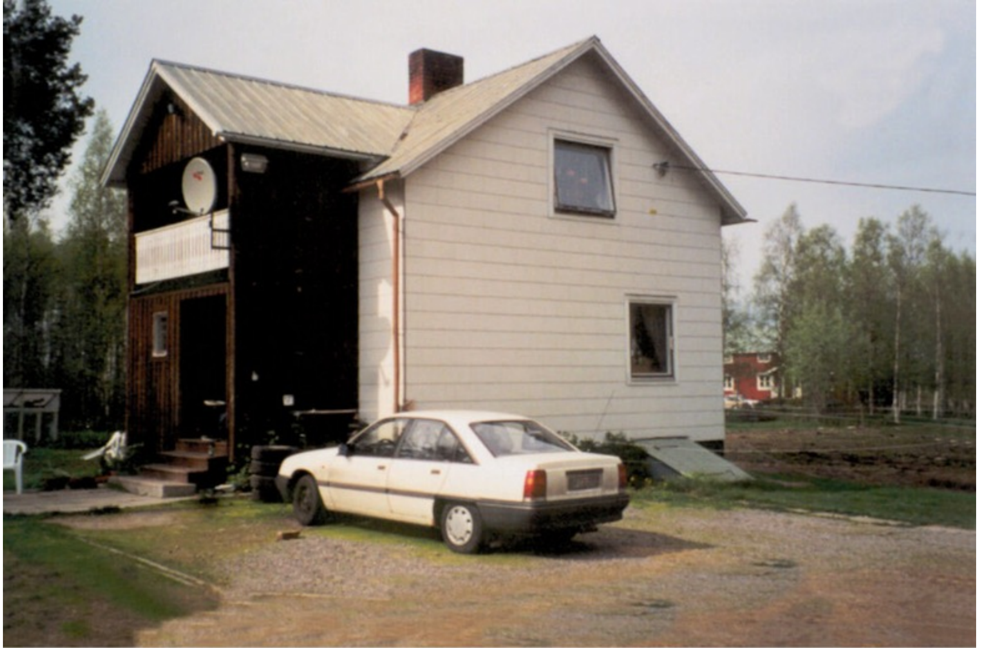
26 B S. Äg. 2001 Kent Vallo & Liselott Taavola. Foto F. Larsson Ersnäs 2001.