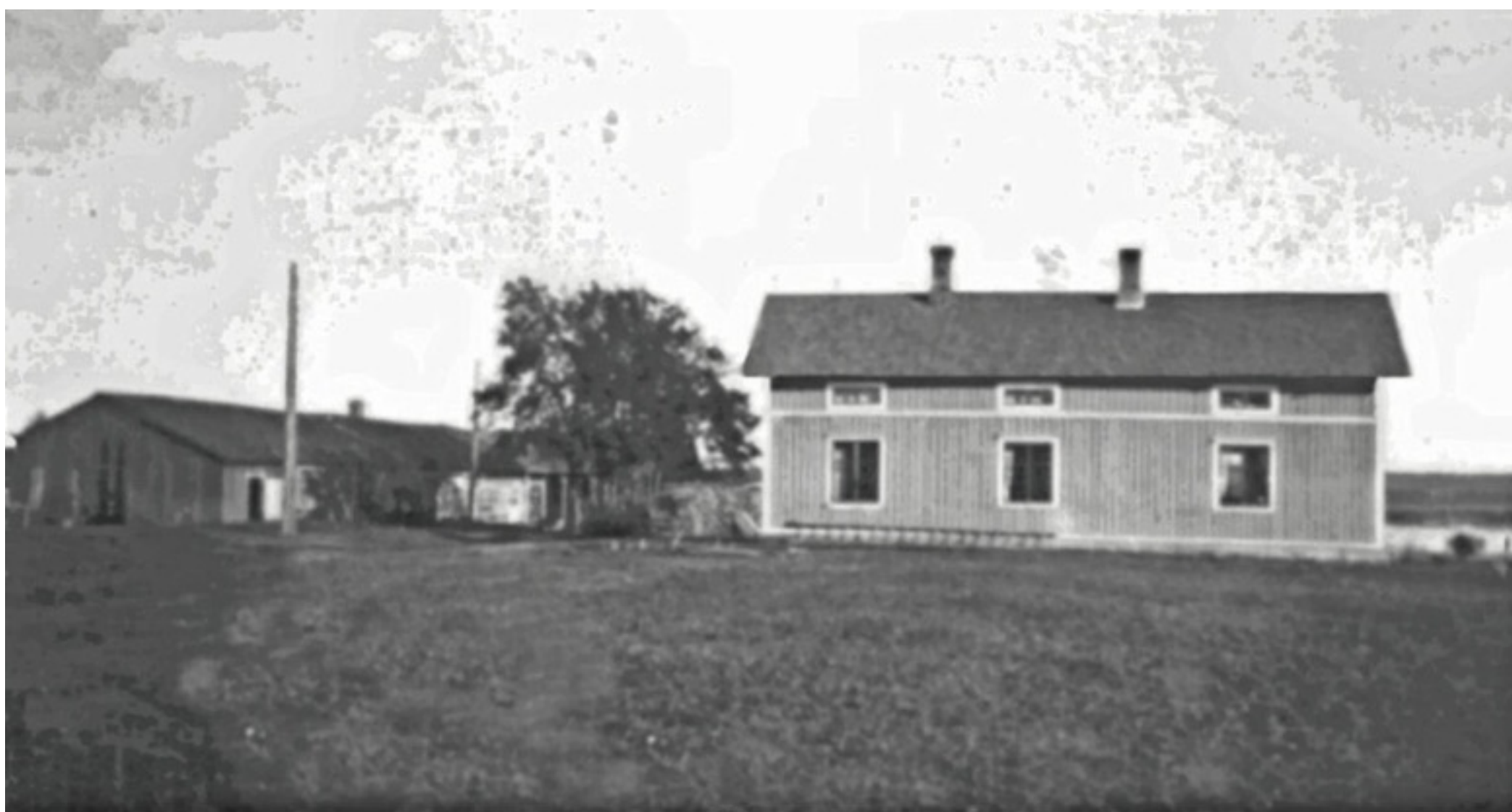
Foto 9. "Sandnäset". Äg. 1948 Helga Nordberg. Äg. 2001 son-sonen Peter Nordberg.

Data-bild-text Folke Larsson Ersnäs.