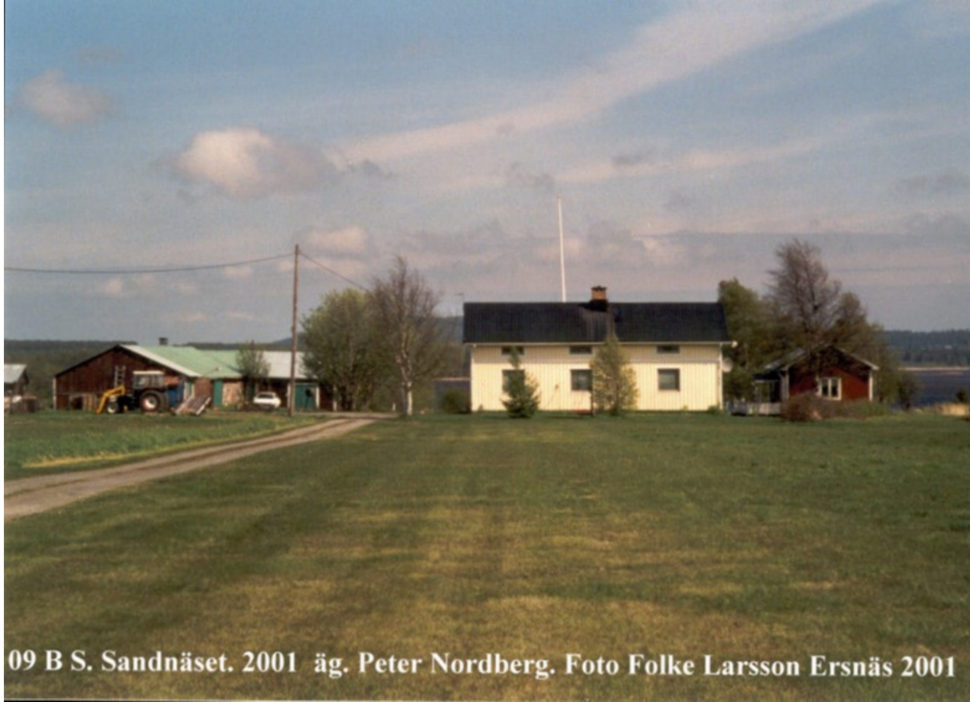
09 B S. Sandnäset. 2001 äg. Peter Nordberg. Ersnäs 2001