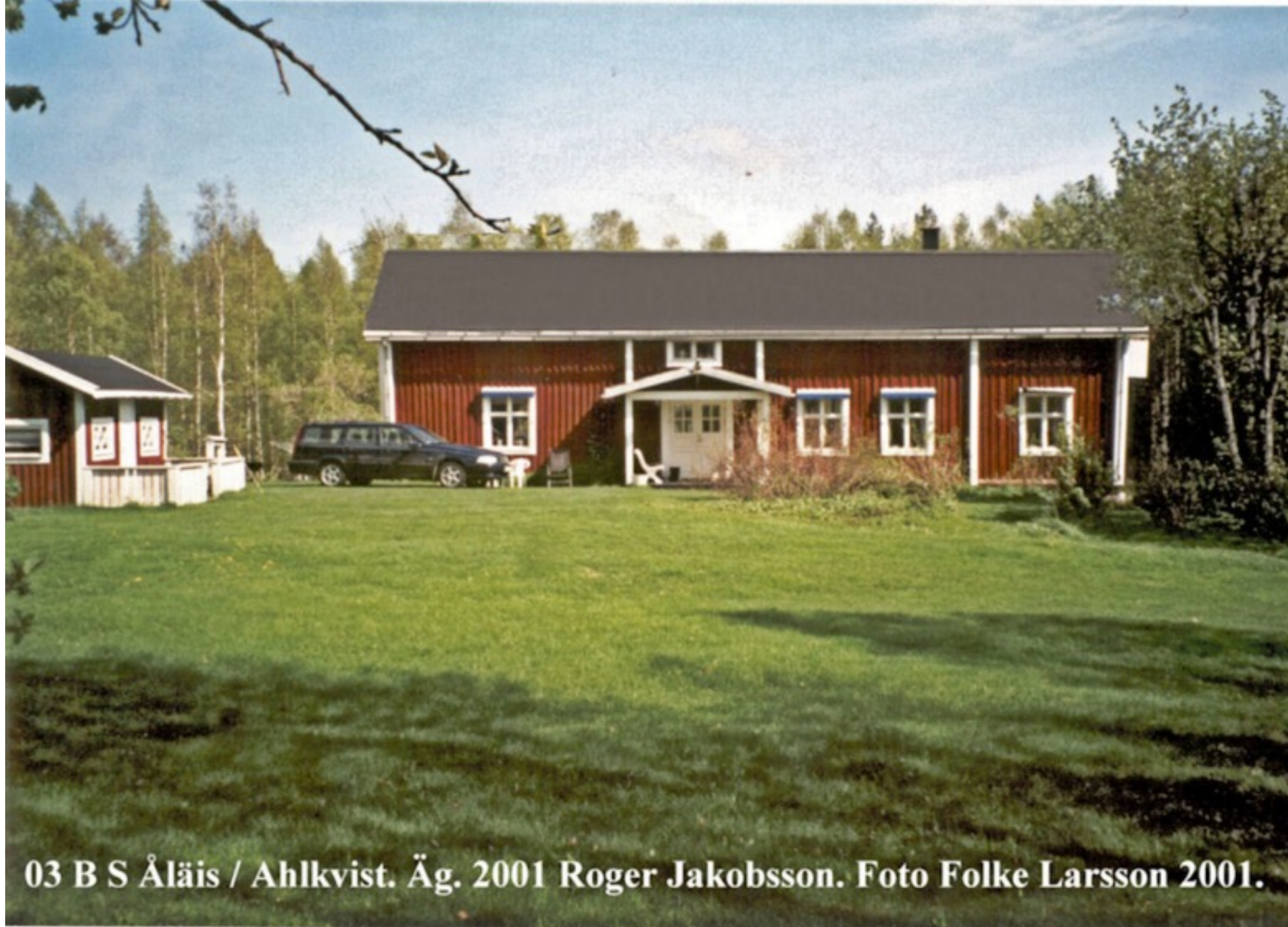
03 B S Åläis / Ahlkvist. Äg. 2001 Roger Jakobsson. Foto Folke Larsson 2001.