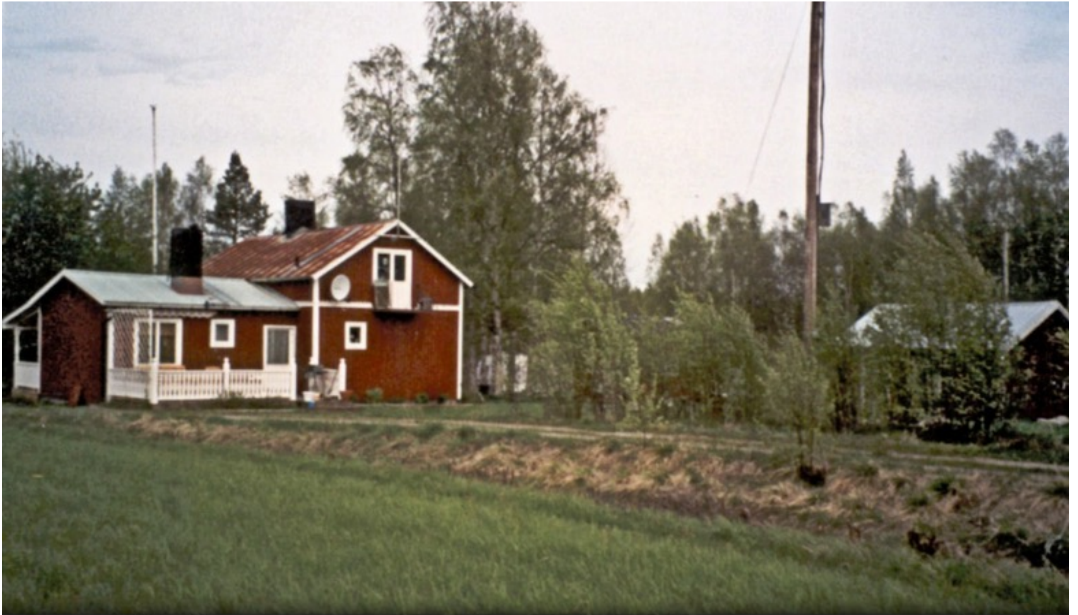
25 B S. Äg. Äg. 2001 Nicklas Johansson. Ersnäs 2001.