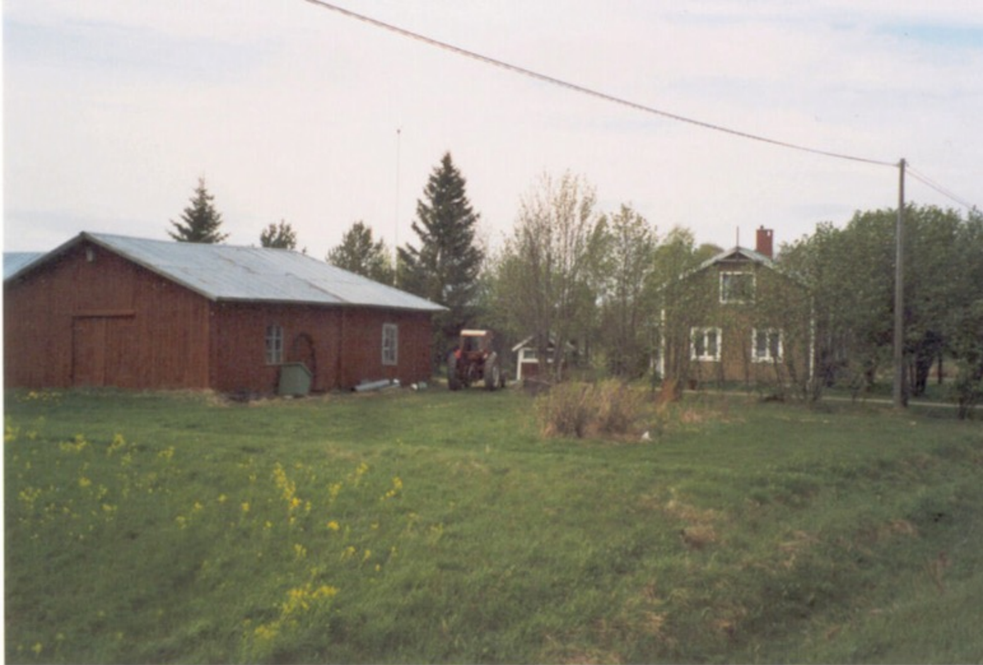
15 B S. DåLa-Isaks. Äg. 2001 Henry Wikberg. Foto Folke Larsson Ersnäs 2001.