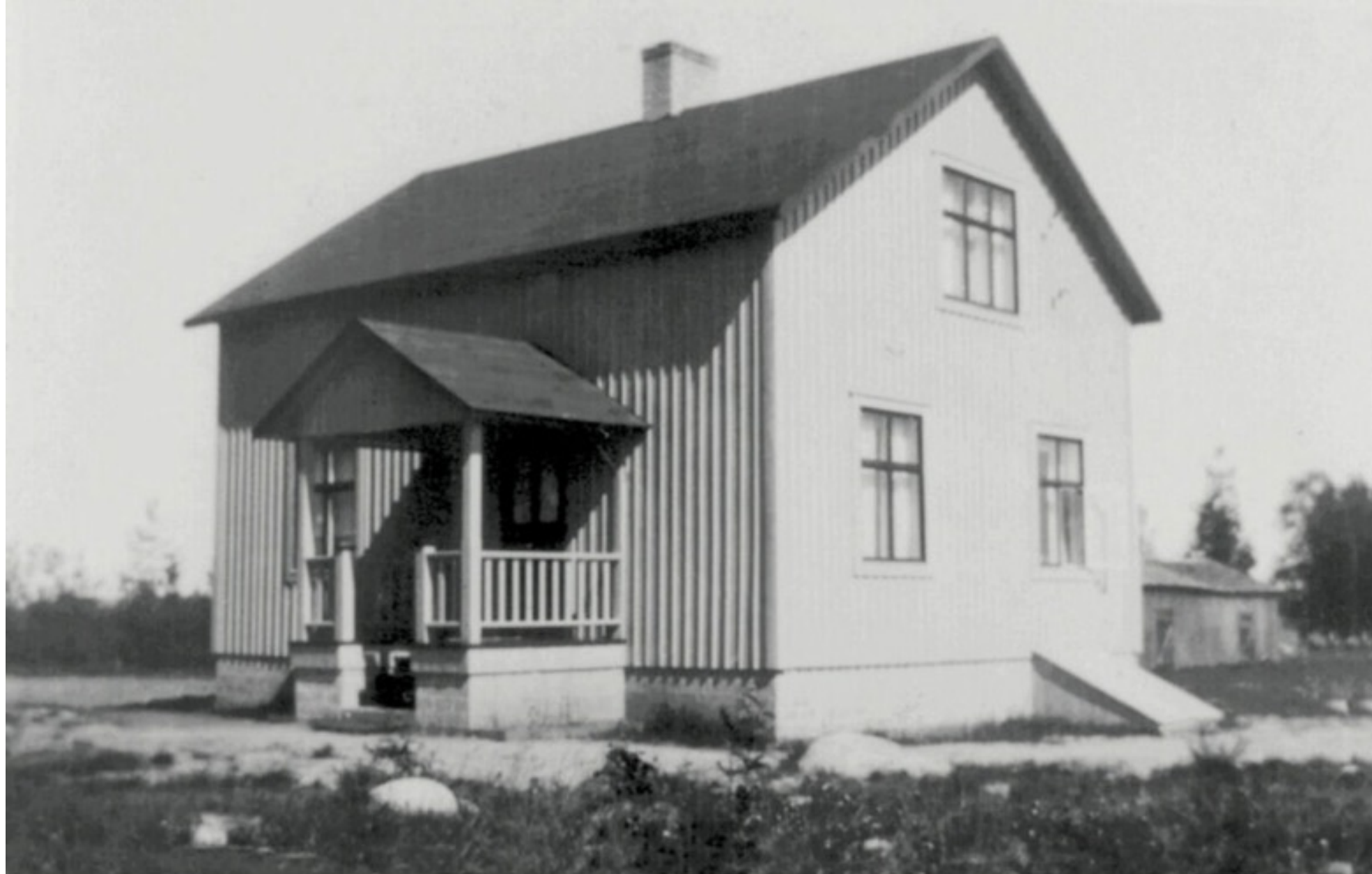
Foto 26. Äg. 1948 Sven Johansson. Äg. 2001 Vallo/Taavola Foto 1948 Malin Eriksson/Hermansson Ersnäs. Databild-text Folke Larsson Ersnäs