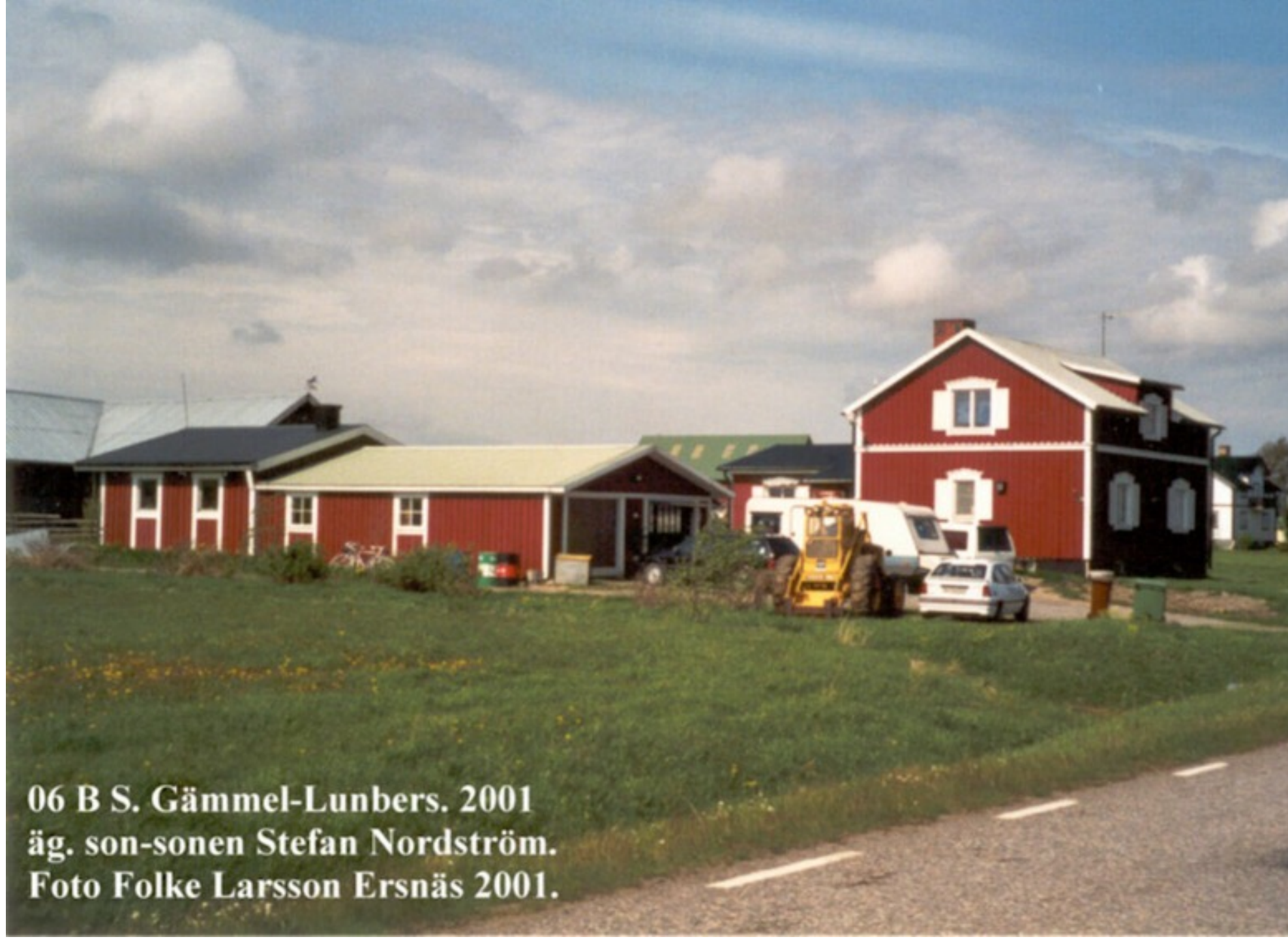
06 B S. Gämmel-Lunbers. 2001 äg. son-sonen Stefan Nordström. Ersnäs 2001.