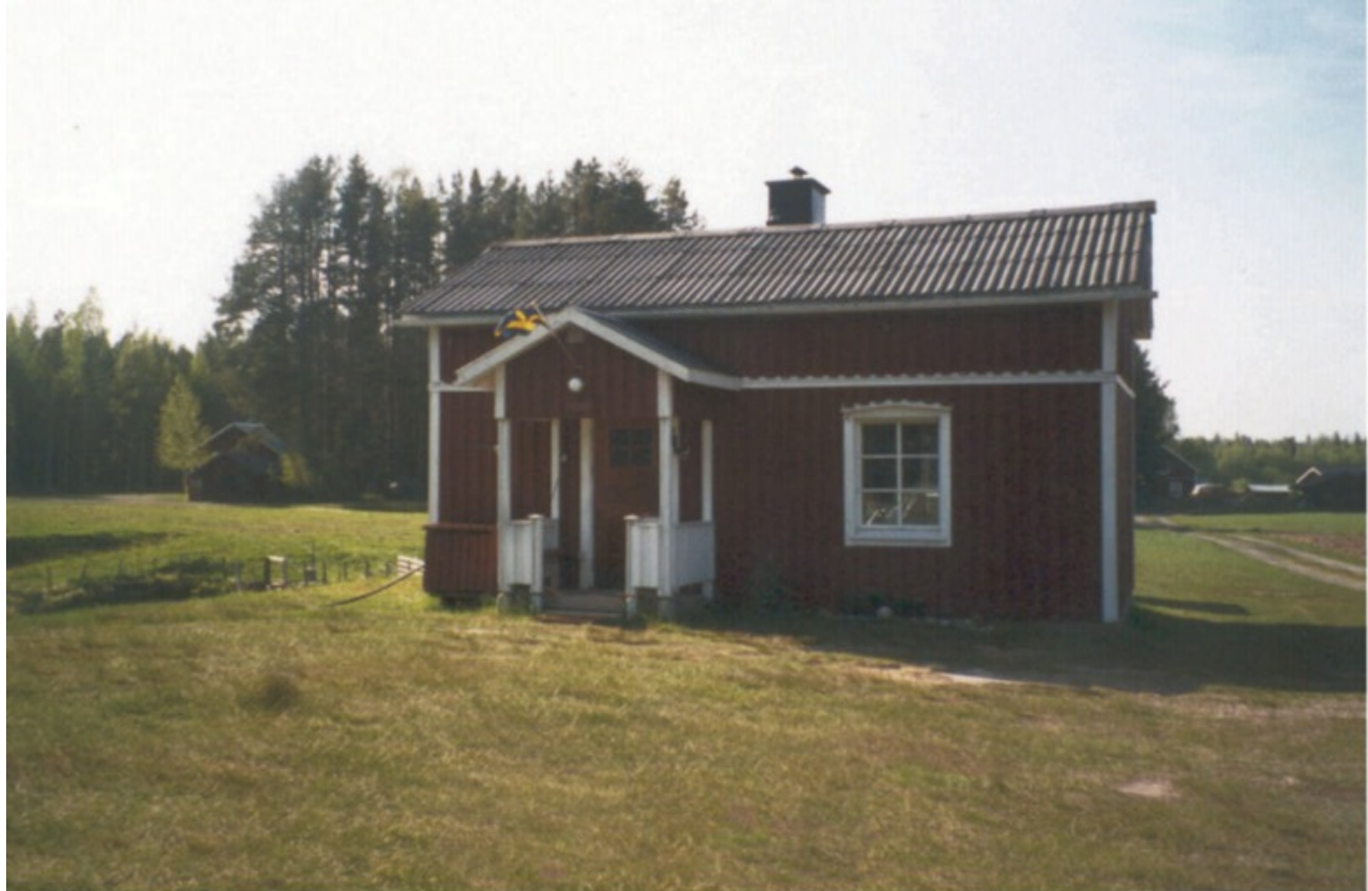
30 B S. "Bäcken". Äg. 2001 Hadar Beckenäs & två bröder. Ersnäs 2001