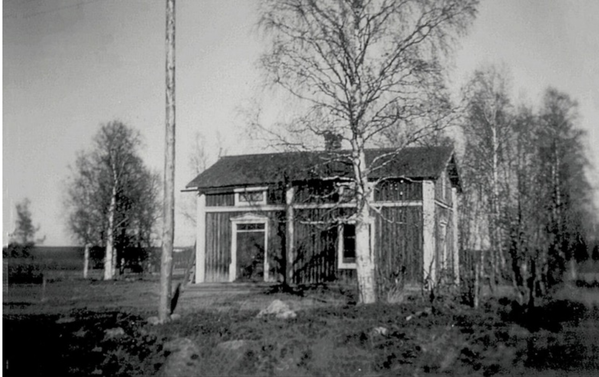
Foto 27. Äg. 1948 Elin Ahlman. Äg. 2001(hus rivet) som på 26. Foto 1948 Malin Eriksson/Hermansson Ersnäs. Databild-text Folke Larsson Ersnäs...