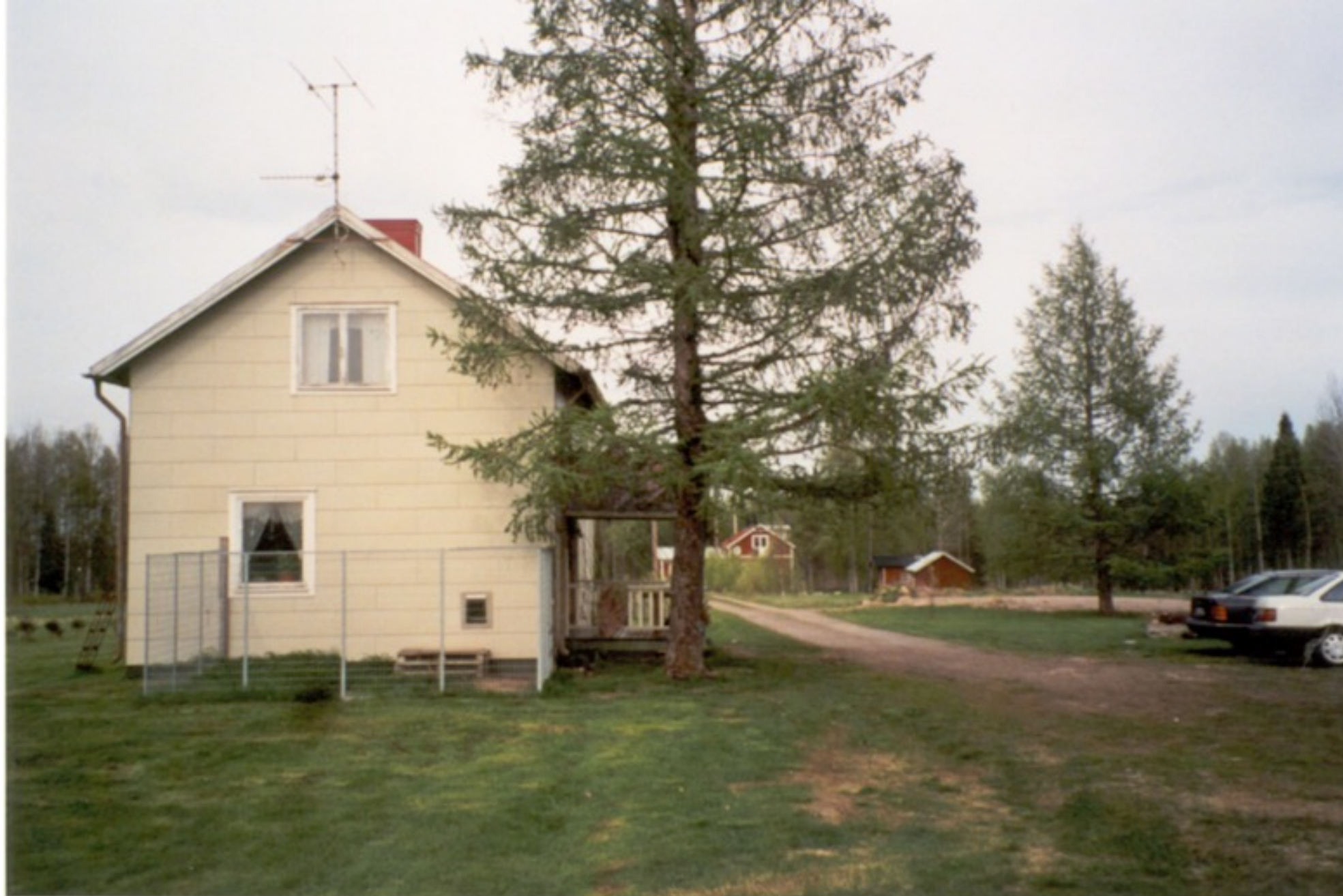
24 B S. Äg. 2001 Björn Sandström. Ersnäs 2001.