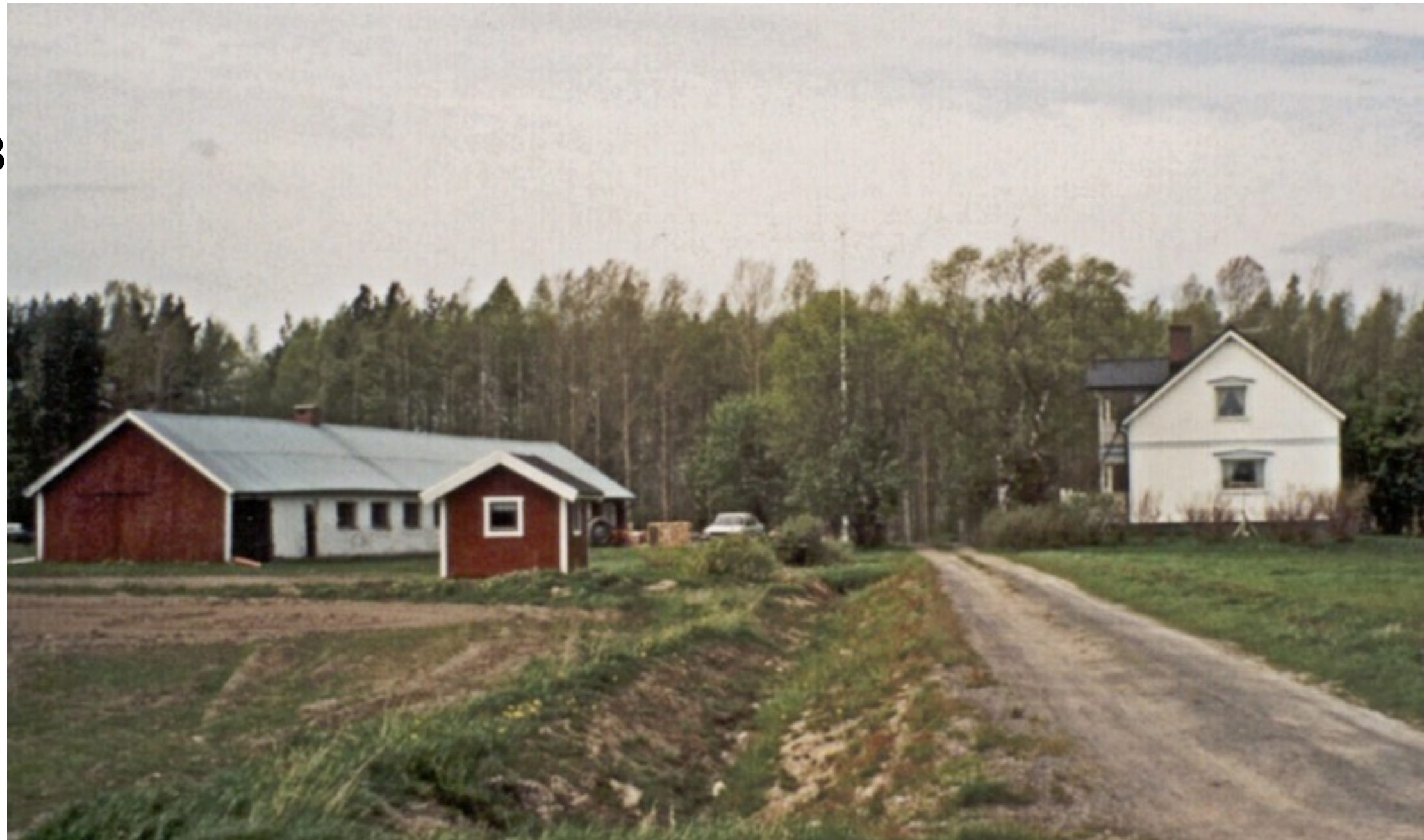
18 B. S. Hedströms. Äg. 2001 sonen Alf Hedström. Foto Folke Larsson Ersnäs 2001.