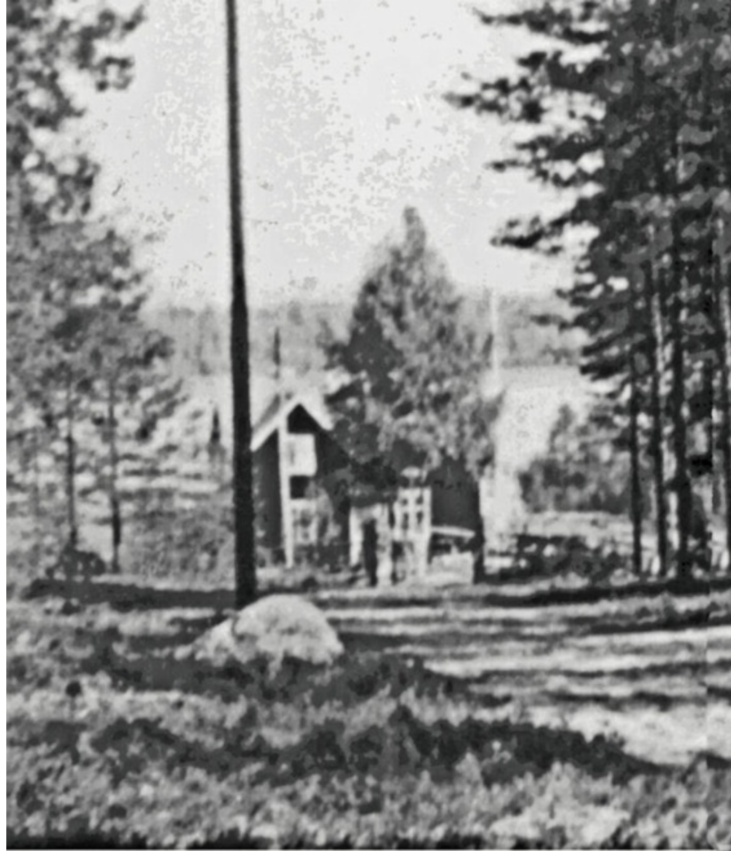
Foto 1."Bränna".Äg. 1948 Valfrid Wallström Äg. 2001 Ove och Allis Wallström.

Foto 1948 Malin Eriksson/Hermansson Ersnäs. Data-bild-text Folke Larsson Ersnäs.