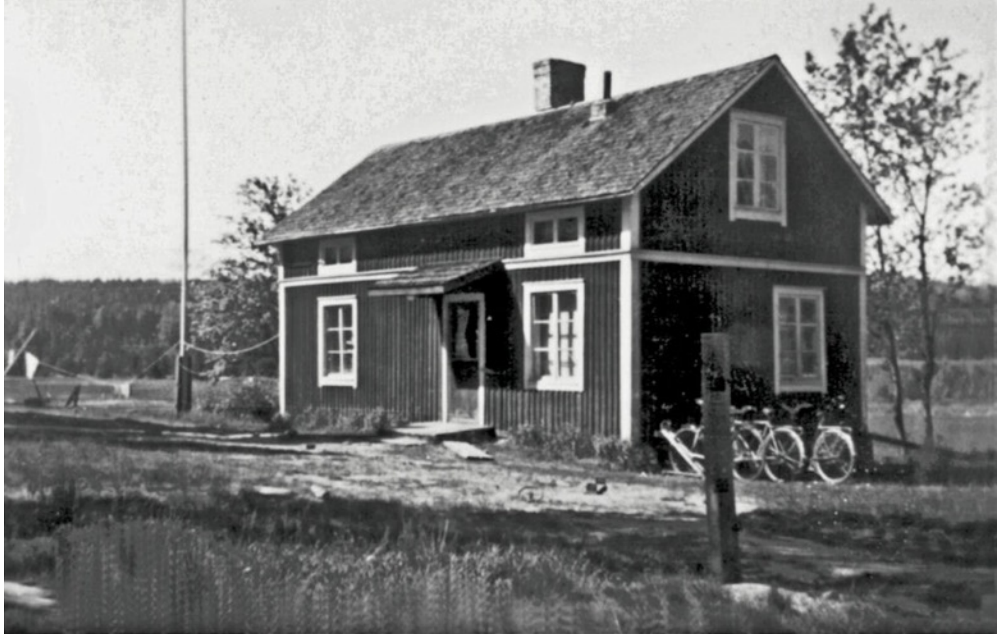
Foto 28."Roséns" Ägare 1948 / 2002-02. Gustav Andersson. Databild-text Folke Larsson Ersnäs.