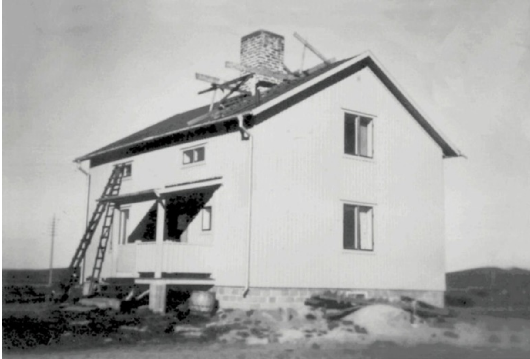
Foto 8. Äg. 1948 Arthur Gustavsson. Äg. 2001 Bertil Kieri. Foto 1948 Malin Eriksson/Hermansson Ersnäs. Data-bild- text Folke Larsson Ersnäs.