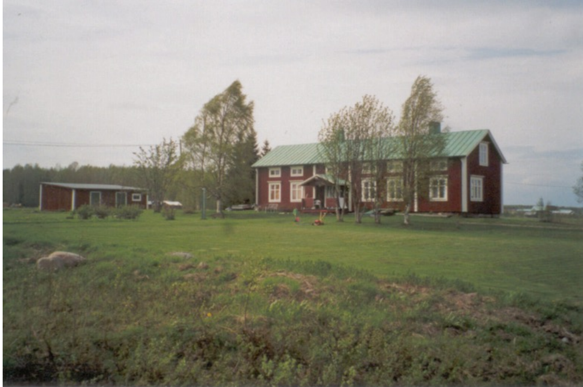
17 B S, DåLas. Äg. 1948 Sven W. Äg. 2001 son-son Anders Wikberg. Ersnäs 2001.