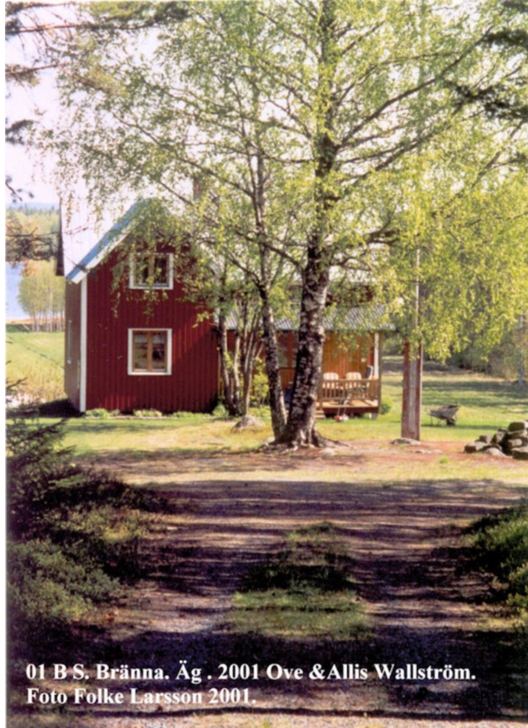
01 B S. Bränna. Äg . 2001 Ove &Allis Wallström. Foto Folke Larsson 2001.