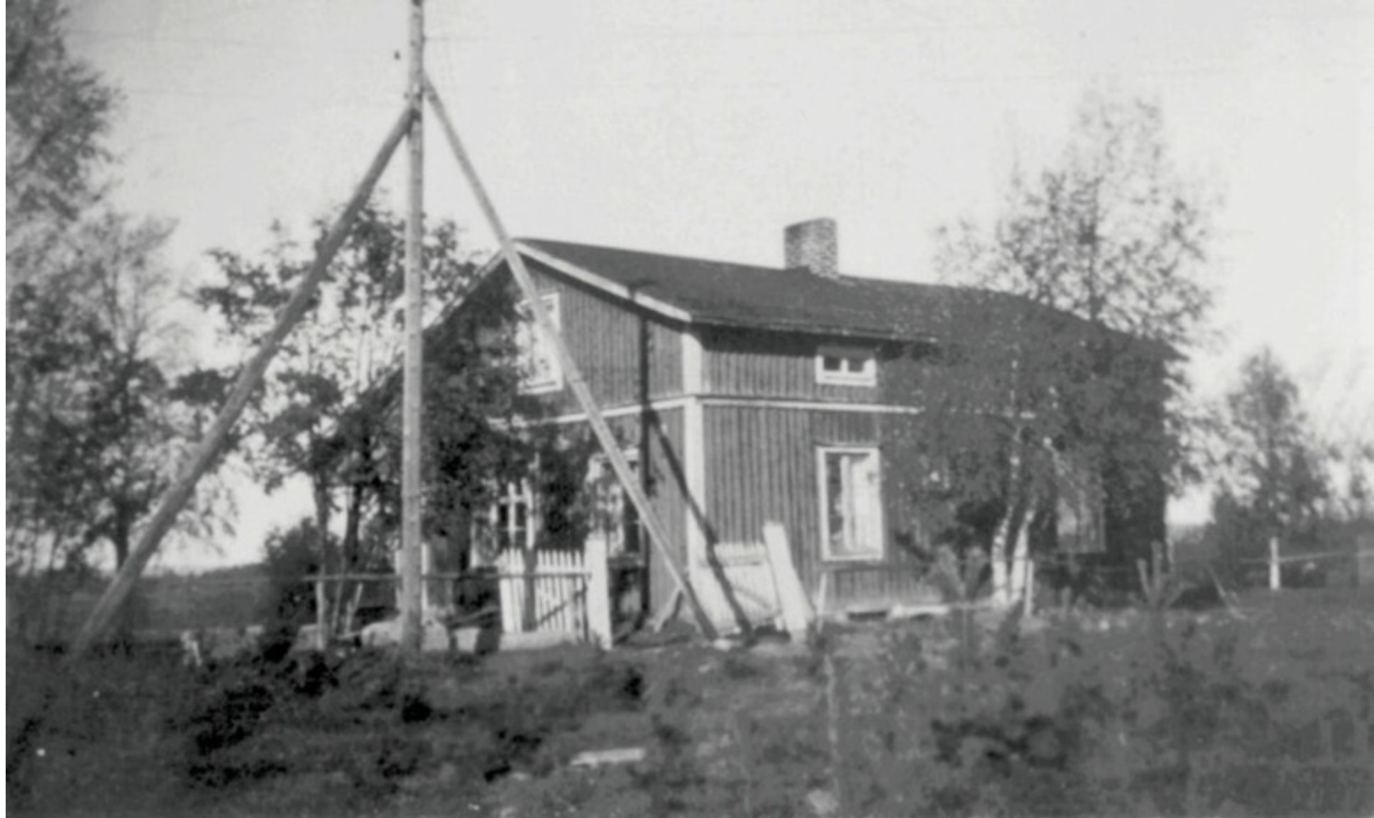
Foto 19."Bäckströms". Ägare 1948, Edvin Bäckström. Ägare 2001, sonen Kjell Bäckström.

Foto 1948 Malin Eriksson/Hermansson Ersnäs. Data-bild-text Folke Larsson Ersnäs.