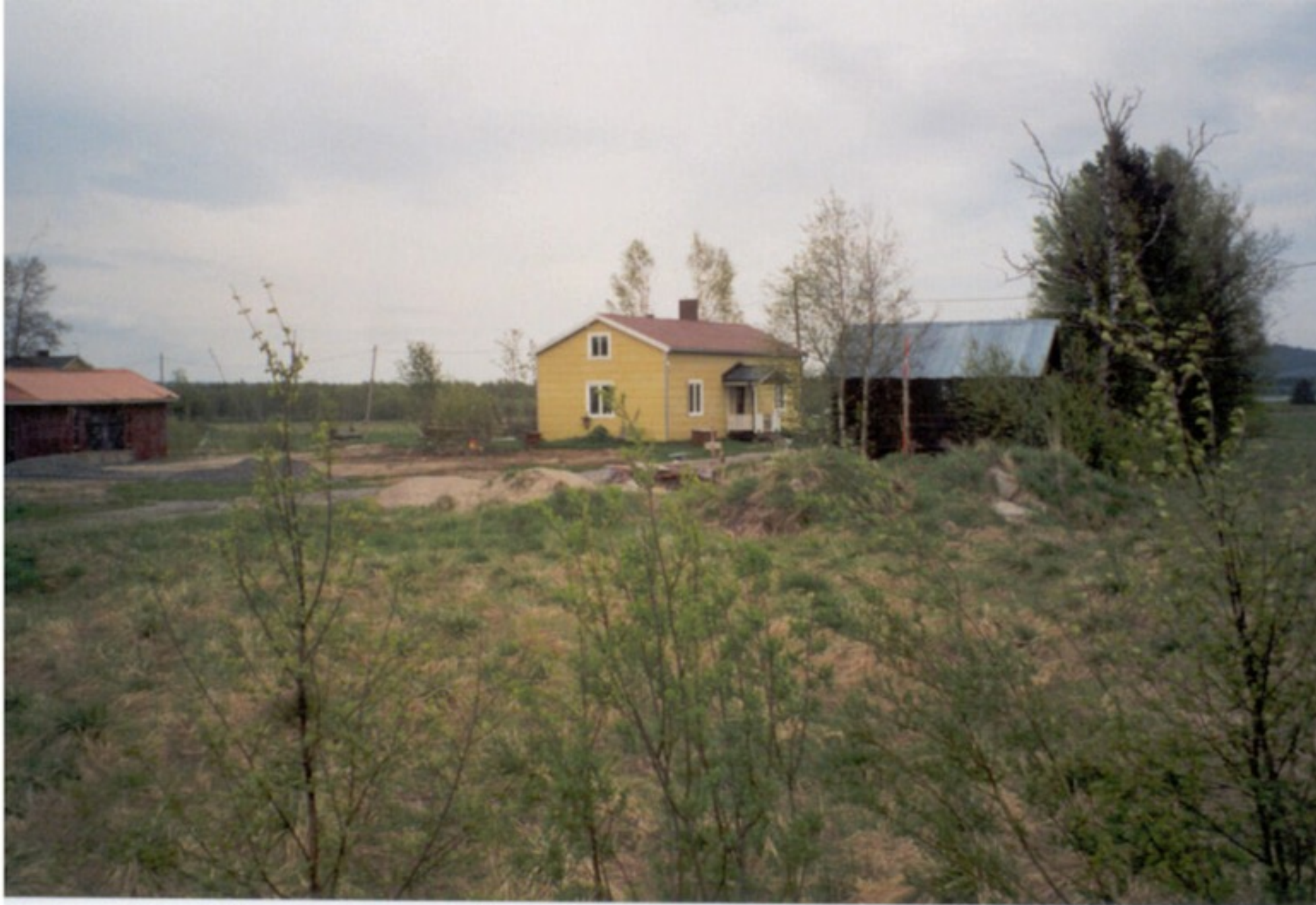
21 B S. "Äänt". Äg. 1948 Anna G. Äg. 2001 Viktor Marklund. Ersnäs 2001.