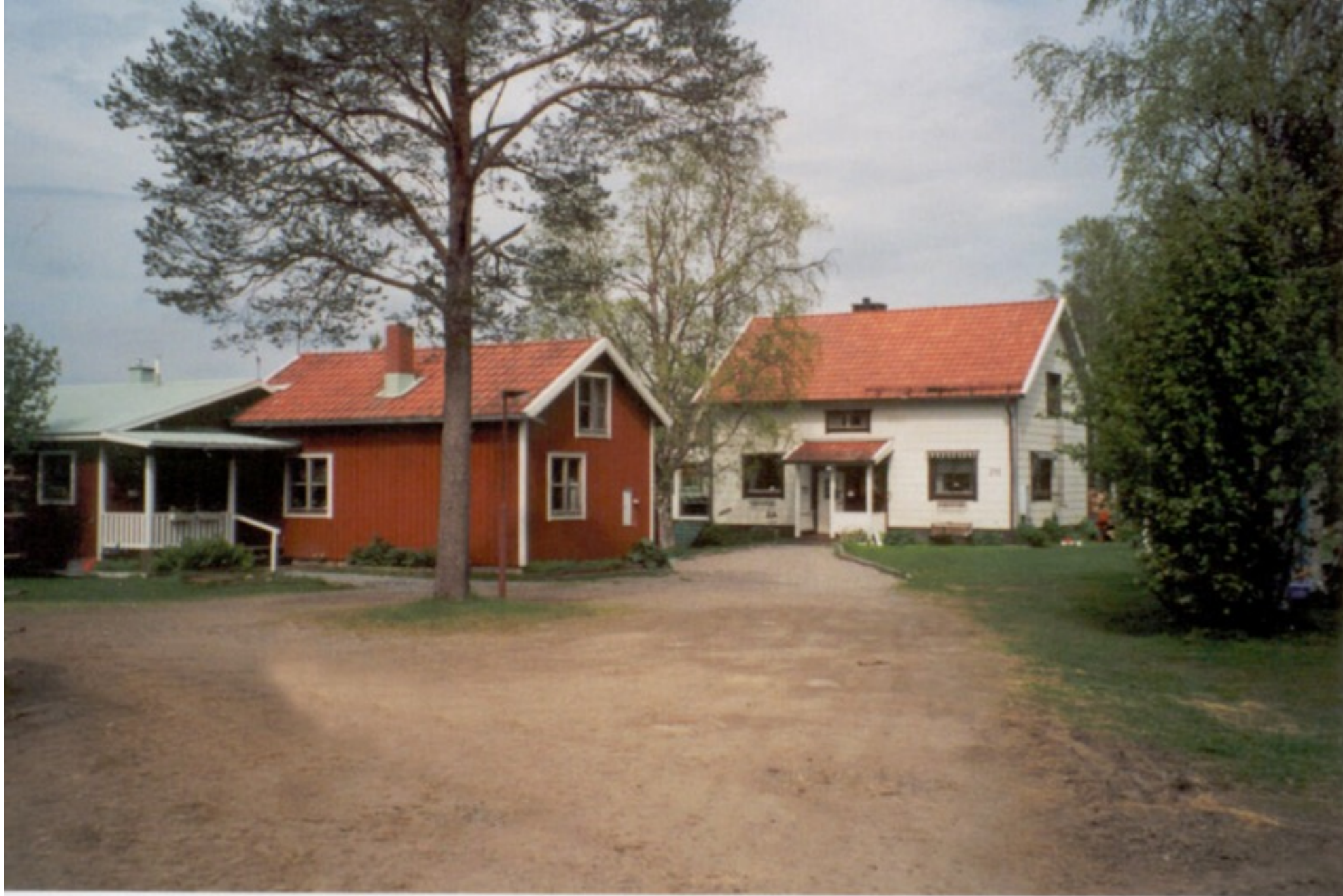
19 B S. Bäckströms. Äg. 2001 sonen Kjell Bäckström . Ersnäs 2001.