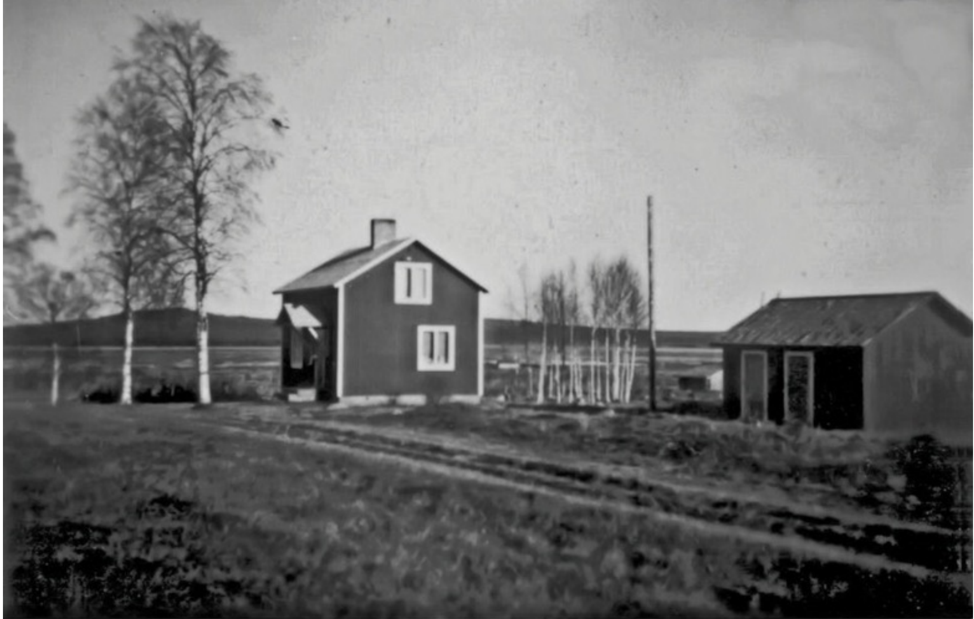
Foto 25 Äg. 1948 Oskar Johansson. Äg. 2001 Nicklas Johansson Foto 1948 Malin Eriksson/Hermansson Ersnäs. Databild-text Folke Larsson Ersnäs.