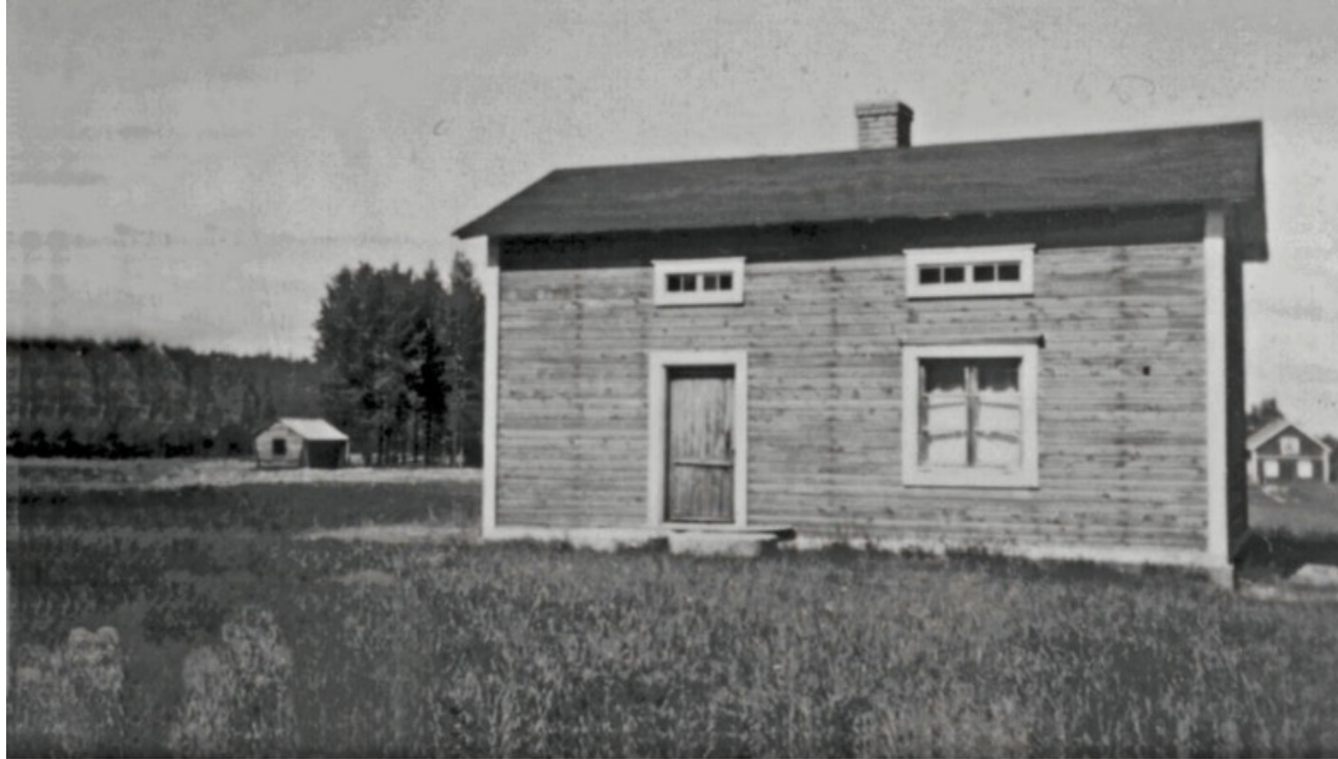
Foto 30. "Bäcken-"Per-Nils".Ägare 1948, Svante Beckenäs Ägare 2001, Hadar Beckenäs Antnäs.

Data-bild-text Folke Larsson Ersnäs.