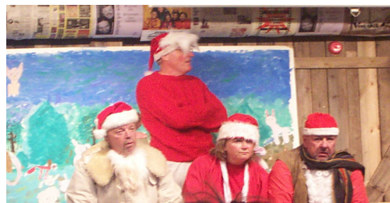
Bilden: Några Brända Tomtar från Ersnäsdagen

* Kategorin SÅNG vanns av Falkenbergsrevyn med sången "Finska Pinnar"