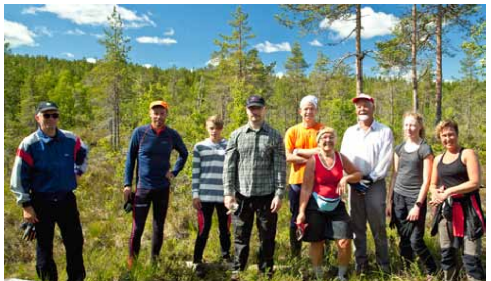
Ett av gängen som deltog i jobbet.

Var försiktig med elden då Du är ute och vandrar.