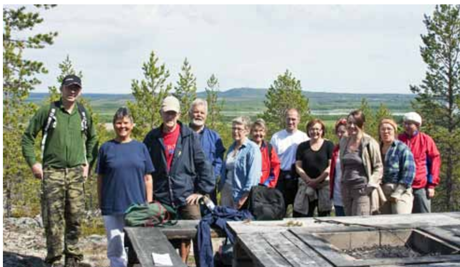
Hembergsledens dag 2008. En paus vid rastplatsen på Hemberget.