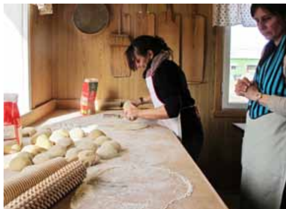
Trivsel i stugan