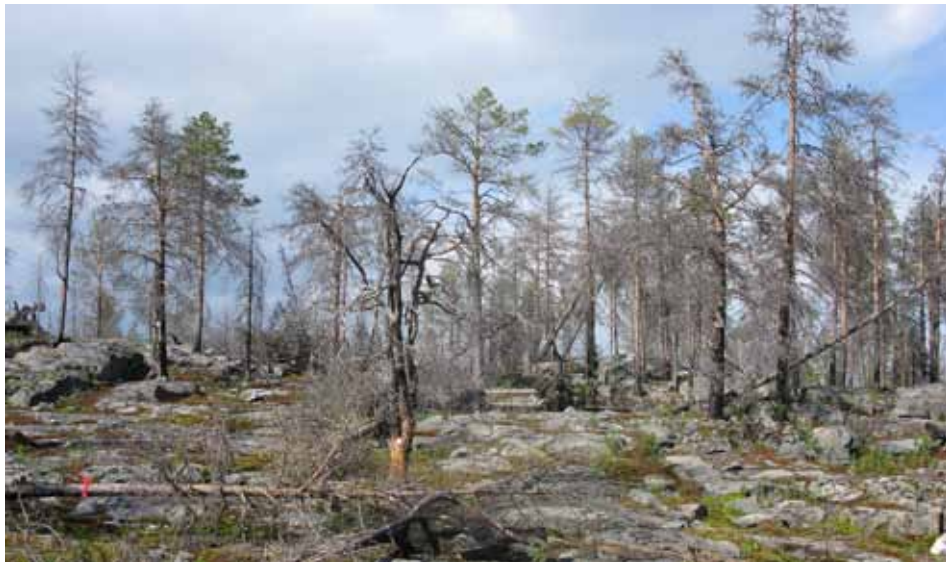
Vid Hembergsleden 2009-06-07 - efter branden 2006-08-10

Marknadsstånden placeras på torget. Loppisförsäljning efter Ersnäsvägen, bord ombesörjes av försäljarna och ingen avgift.