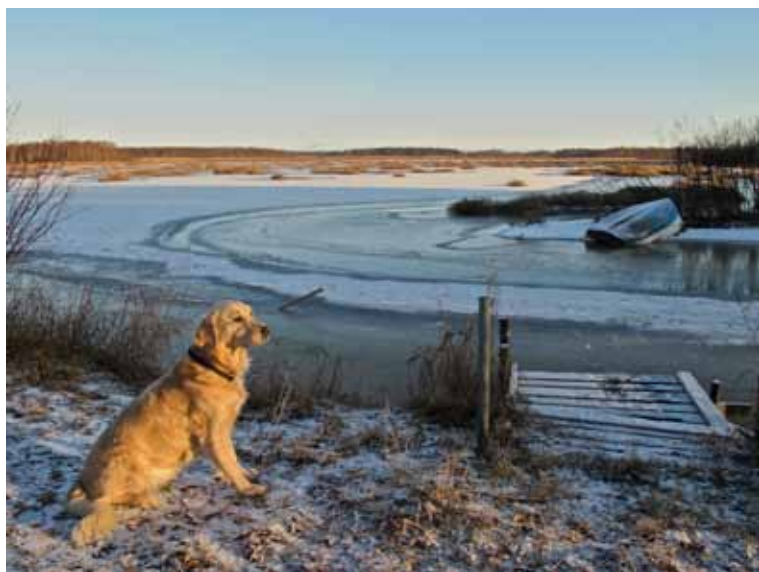
2014-11-09 kl. 13.24 vid Dålakajen