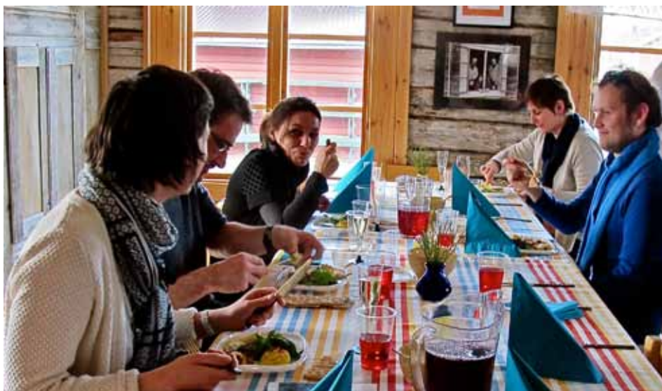
En matpaus i Torpet på Torget i Ersnäs

RYSA skolprojekt drivs av medel ur EU:s skolprogram Erasmus med Luleå