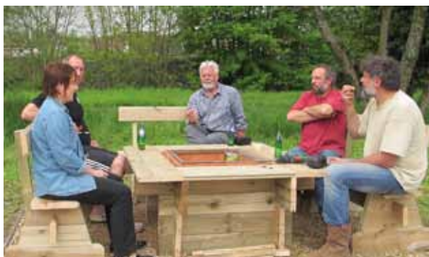
Första sittningen - arbetspaus

Vid ett gemensamt besök 2013 i Novéant, som ett antal ersnäsbor gjorde, byggdes en grill i deras fritidsområde nere vid floden Moselle. Det blev ett