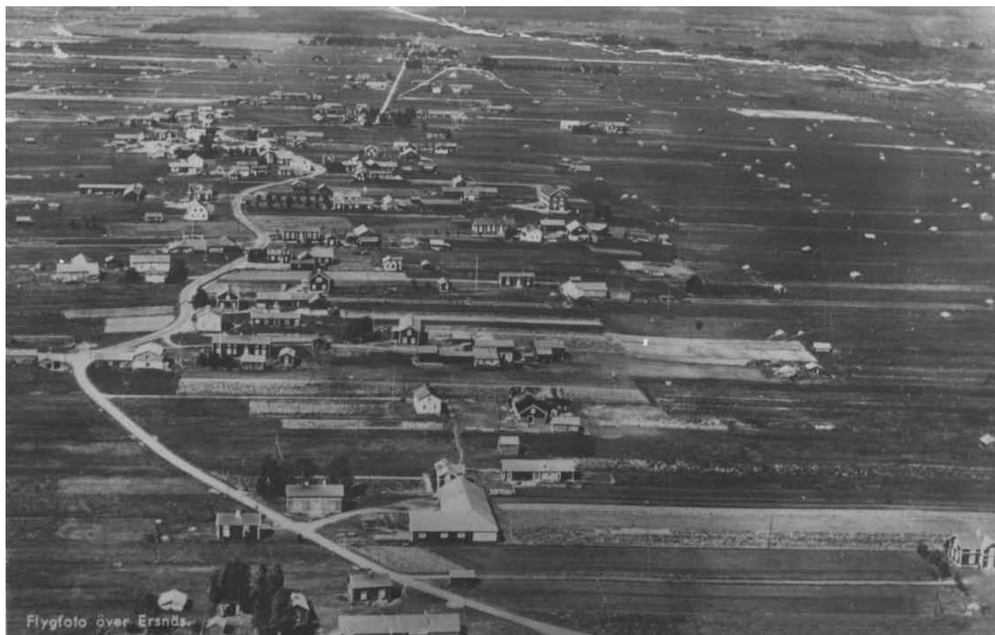
Flygfoto över Ersnäs.

Ersnäs IF Plusgiro 65472-3 Bankgiro 5970-5996