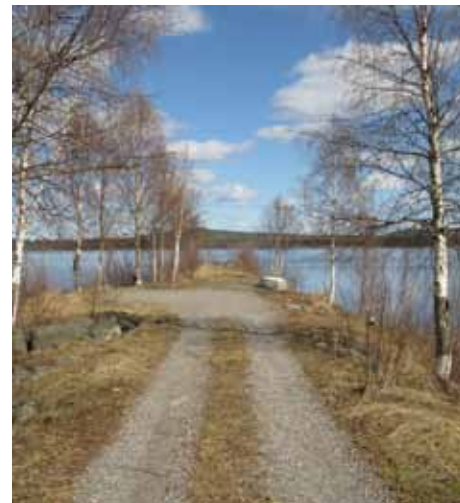
Resterna av Dålakajen en vårdag.

ställdes till det, var det möjligt för rätt stora båtar att gå in här. En reguljär ångbåtstrafik en bra bit in på 1900-talet upprätthölls mellan Luleå och Piteå med Dålakajen som en av angränsningspunkterna. Nu återstår endast en pir som befinner sig i ett något sorgligt tillstånd. Men även utan landhöjning hade båttrafiken upphört. Det är inte så lätt att konkurrera med våra dagar sätt att transportera folk och gods.