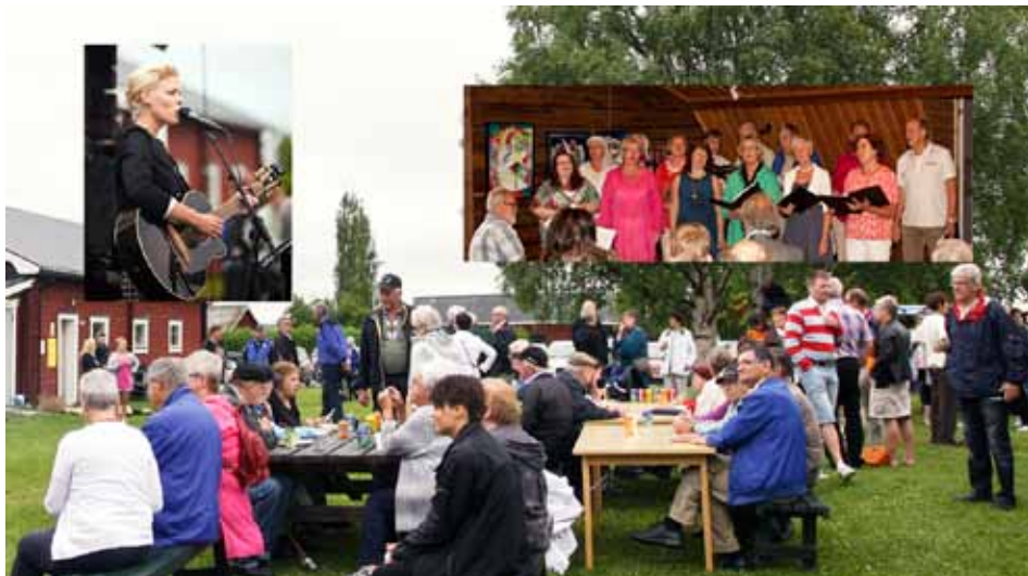
Ersnäsdagen genomfördes traditionsenligt med mat och underhållning på Torget samt Ralph Lundstengården.