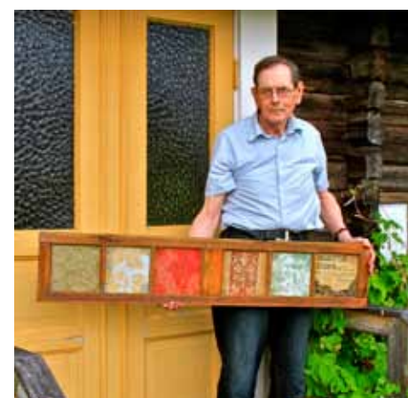
Folke med fönsterramen

Ett stort Tack från Hembygdsföreningen till er.