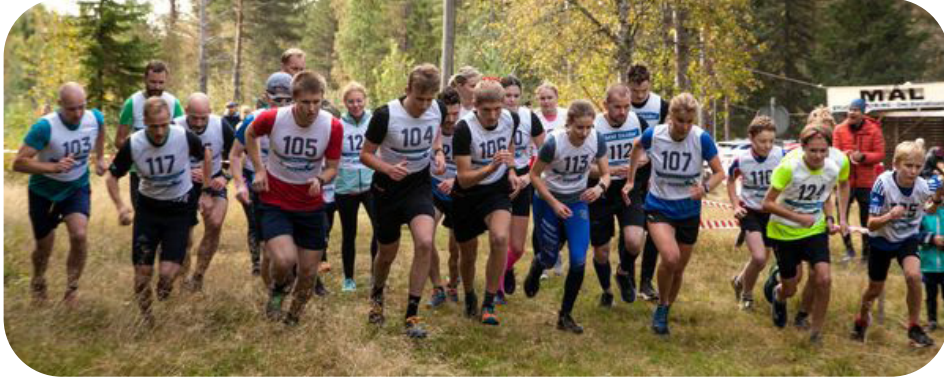
Starten i Hembergsutmaningen 2023

Den 17 september avgjordes Hembergsutmaningen 2023. Dryga femtio startande fördelade på sträckorna 500 m, 2 500 m och 6 km. När det var dags för de yngsta att starta behagade några solstrålar bryta igenom molnen. Det blev med andra ord en trevlig tillställning där åskådare och deltagare kunde inmundiga parisare eller fika med hembakat.