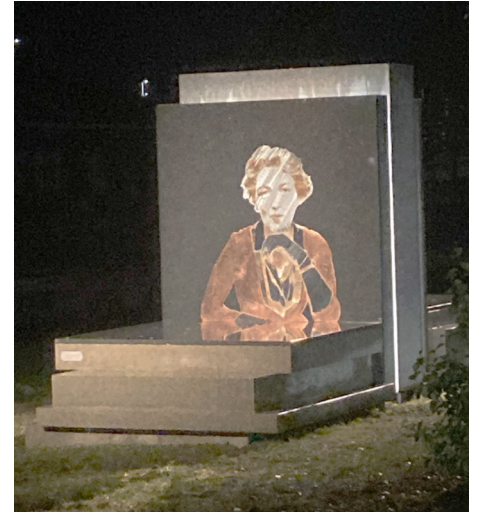
Monumentet på plats vid järnvägsstationen.