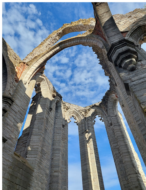
S:ta Karins kyrkoruin i Visby och en rauk.

Vi besökte Ganns ödekyrka som är från 1200-talet, numera en ruin. I närheten av kyrkoruinen finns Hångers Källa, det sägs att Israel Kolmodin besökte källan och fick inspiration att skriva den