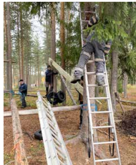
Arbeten vid Äventyrsbanan