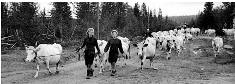
Kvinnor som transporterar kor till Sverige mellan Torneå och Haparanda den 19 september 1944 under evakueringen av norra Finland.

Sovjetunionen angrep Finland den 30 november 1939, vilket var starten till vinterkriget. Finland tvingades efter krigsförlusten överlämna stora landområden till Sovjetunionen. I juni 1941 startade fortsättningskriget där Finland på tyskarnas sida stred mot Sovjetunionen i syfte att återta de förlorade områdena. Nazityskland förlorade kriget mot Sovjetunionen och Finland lyckades bevara sin självständighet genom att lämna alliansen 1944. Tyskarna tillämpade "den brända jordens taktik" och lämnade norra Finland i ruiner. I september 1944 slöts en överenskommelse mellan Finland och Sverige om att vårt land skulle ta emot 100 000 flyktingar. Sammanlagt evakuerades 103 885 personer och 51 000 husdjur från norra Finland. Av dem kom 56 417 personer och 18 000 husdjur till Sverige och resten till