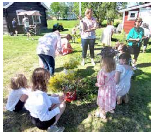
Midsommarstången ska kläs

Människor kan indelas i två grupper, en som går före och uträttar något, och en som kommer efter och kritiserar. /Seneca