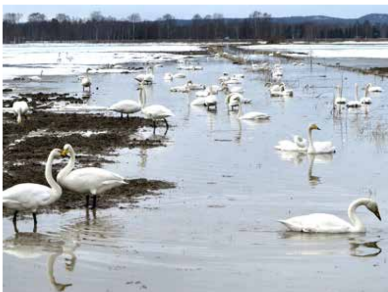
Vårfåglar i Alvik 25 april