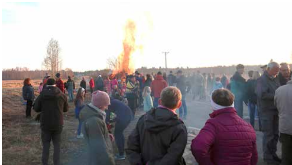
Årets Majbrasa samlade många bybor - ett trevligt arrangemang! Tack EIF!