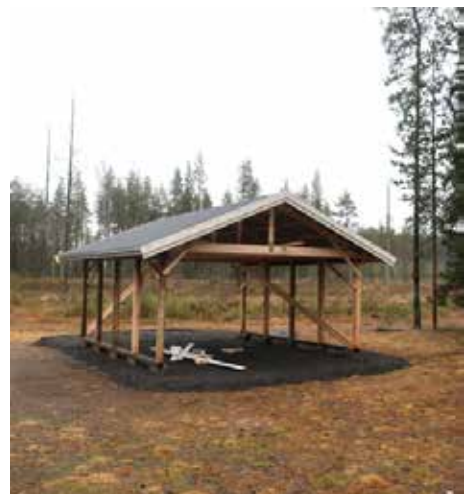
Bygget söndag 2018-11-11

På Gläntan/Skidstadion har det uppförts en ny byggnad – en carport som skall användas för förvaring/skydd åt spårutrustning. Idrottsförening har länge funderat kring hur sladd och spårmaskin skall förvaras och nu är den äntligen på plats.