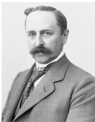
Nils Edén, en blivande statsminister som gjorde många resor genom Ersnäs by på dåvarande rikstretton på sin väg Piteå-Luleå-Piteå.

Och vi norrbottningar har en speciell anledning att känna stolthet med anledning av detta beslut. I oktober 1917 tillträdde en regering med liberalen Nils Edén som statsminister. Regeringen var en koalition av liberaler och socialdemokrater. Frågan om kvinnlig rösträtt hade första gången väckts i riksdagen 1884. Högern (det parti som idag heter Moderaterna) gjorde under alla år ett hårdnackat motstånd. Detta