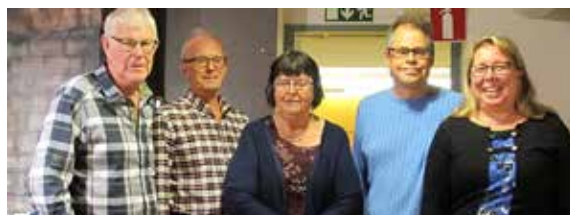
Arrangörerna i en paus